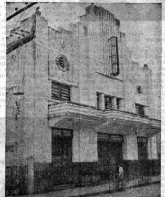
Cine Santa Rosa