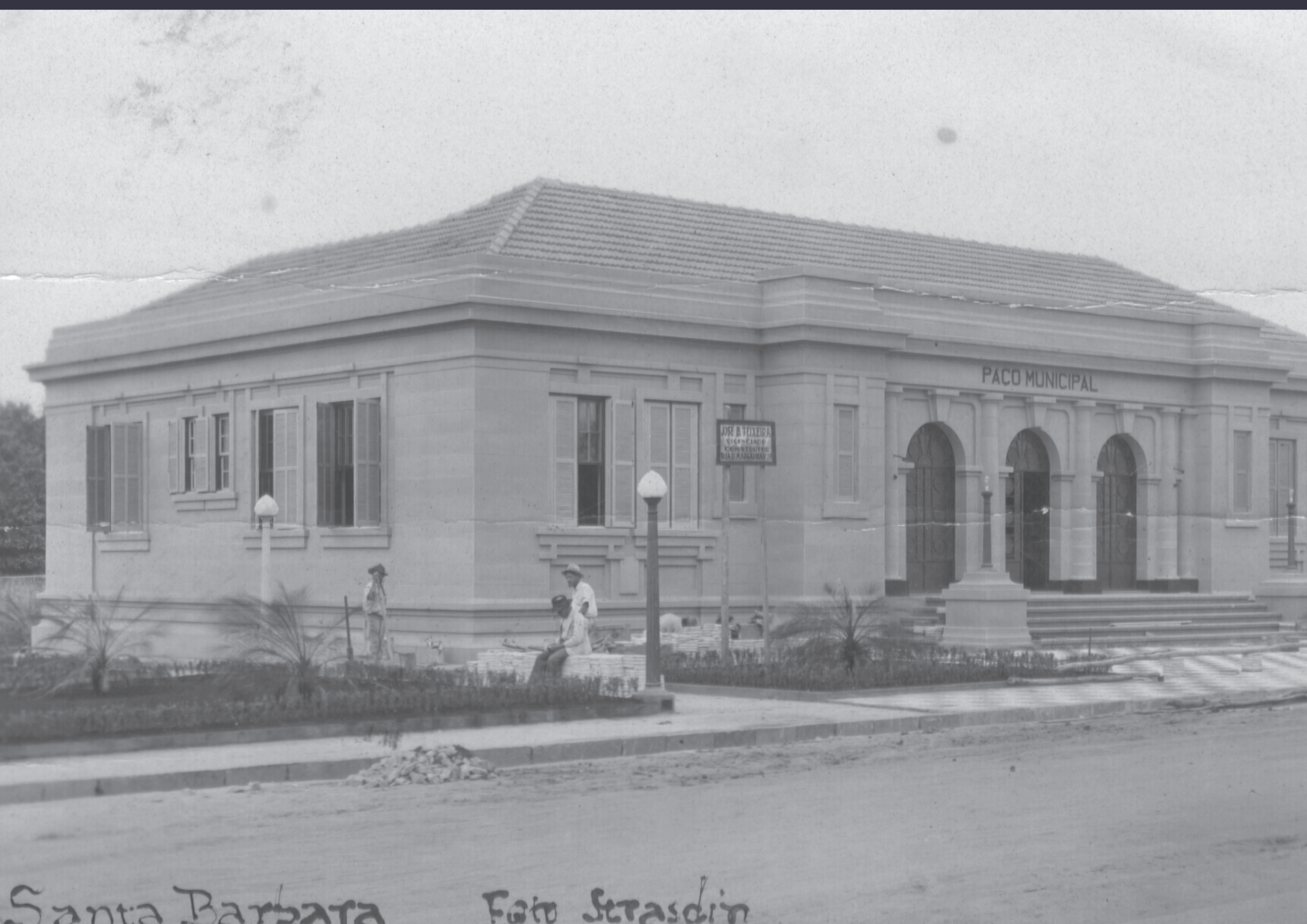
Santa Bárbara