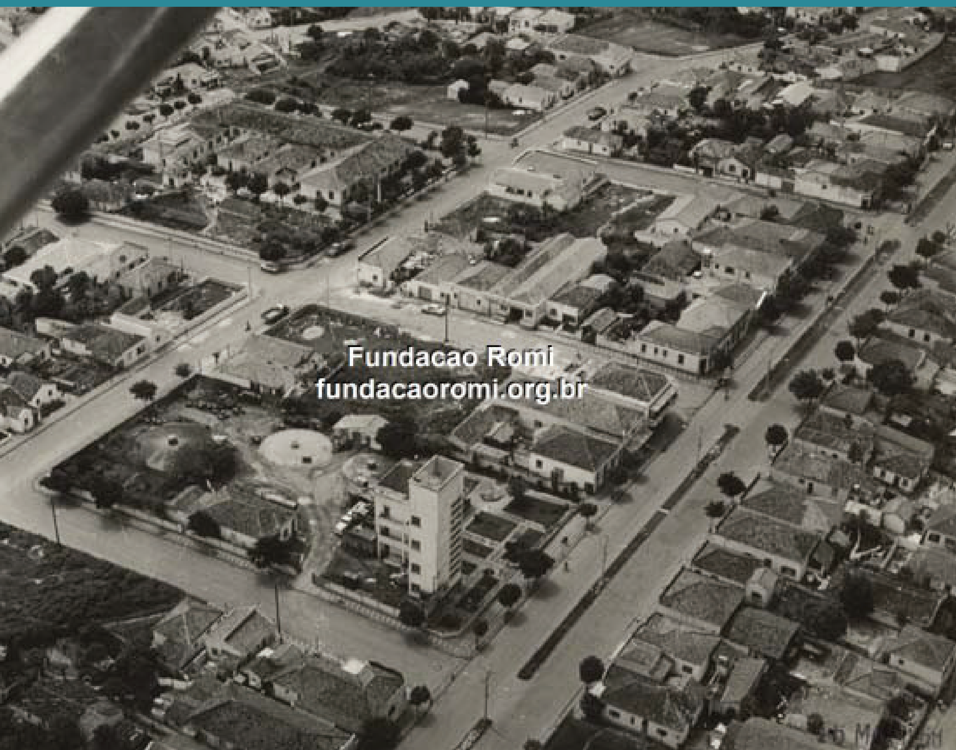
Fundação Romi fundacaoromi.org.br