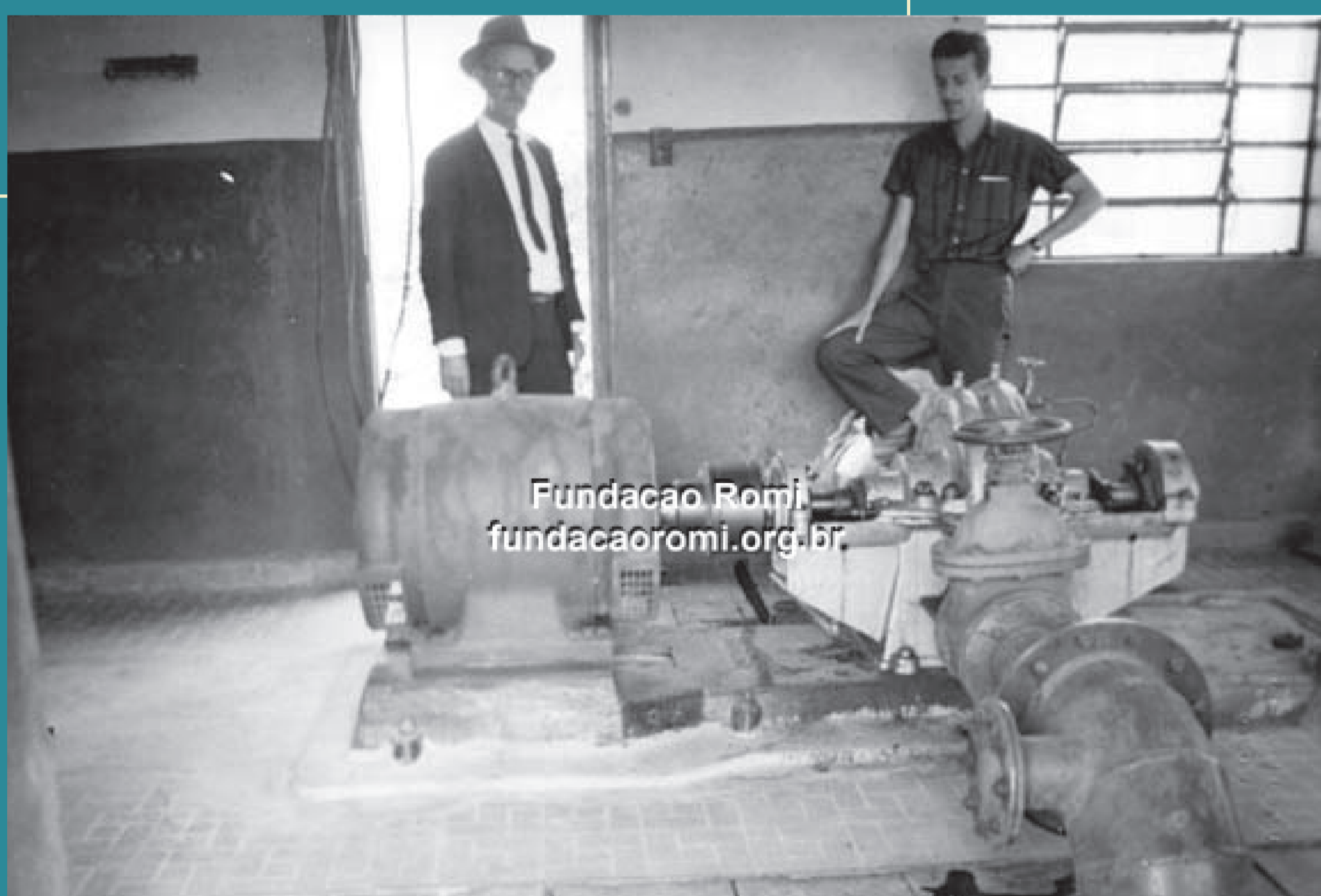
Fundação Romi fundacaoromi.org.br

Vista aérea da ETA I. Da direita para a esquerda, vê-se, a Avenida Monte Castelo, o prédio da ETA I, a Rua Maestro Lázaro Domingues e o prédio da Santa Casa de Misericórdia. Da esquerda para a direita, vê-se, a Rua Camilo Augusto de Campos, a Rua José Alencar e a Rua Alice Aranha de Oliveira Foto: Augusto Strazdin