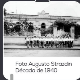
Década de 1940