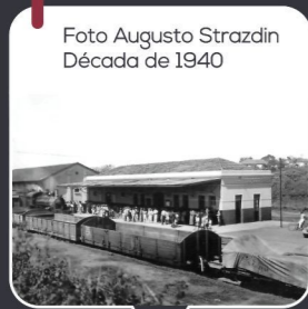
Década de 1940