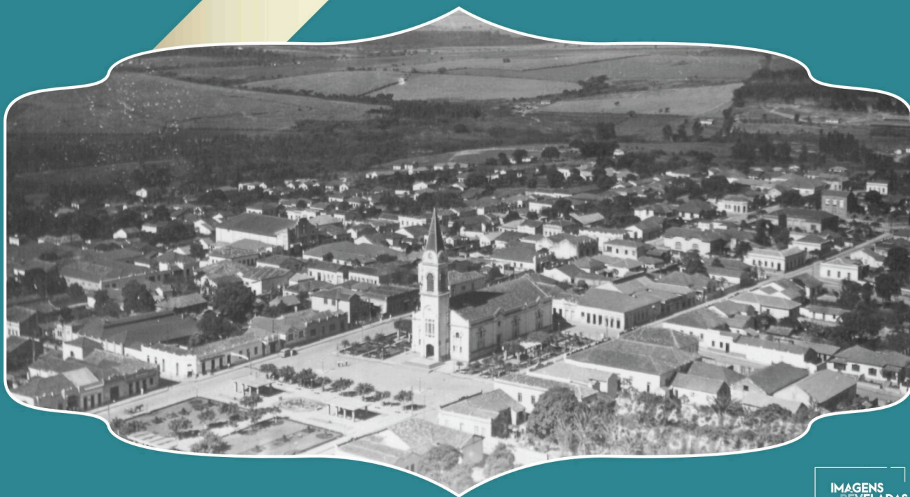
Vista aérea da região central de Santa Bárbara, 1947.