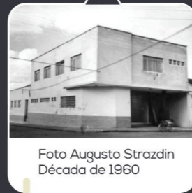
Década de 1960