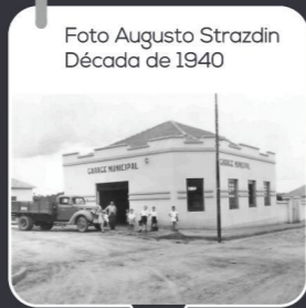
Década de 1940