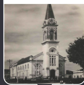
Década de 1930