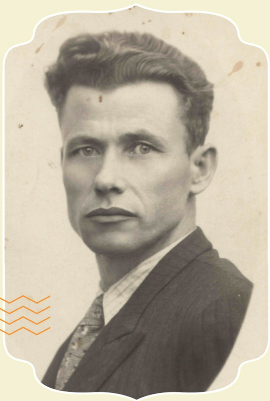
Fotógrafo Augusto Strazdin, década de 1930.