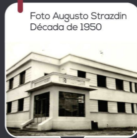
Década de 1950