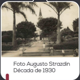
Década de 1930