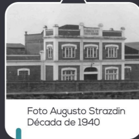
Década de 1940