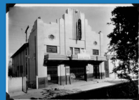
Localização: Rua XV de Novembro, 861, centro, Santa Bárbara d'Oeste.