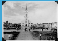
Localização: Praça Rio Branco, s/n, centro, Santa Bárbara d'Oeste.