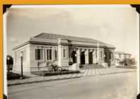
Localização: Rua João Lino, 382, centro, Santa Bárbara d'Oeste.