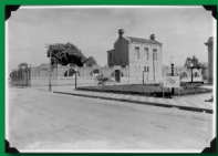
Localização: Rua João Lino, 371, Santa Bárbara d'Oeste.